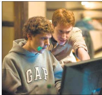
Wird «Social Network» zum besten Film erkoren?