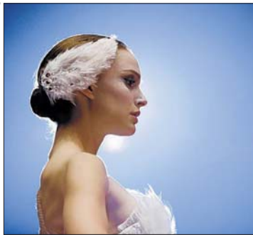
Oscar-Favoritin Natalie Portman («Black Swan»).