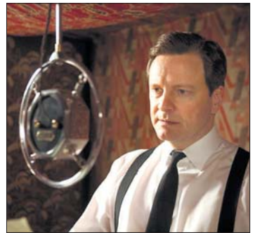
Oscar-Favorit Colin Firth («The King's Speech»).